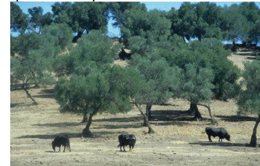
In der Extremadura werden Horstbäume zum Schutz des Rotmilans vom jährlichen Baumschnitt ausgespart.

In den spanischen Überwinterungsgebieten bewohnt der Rotmilan bevorzugt die offenen Agrarlandschaften von Kastilien und die Dehesas der Extremadura wo auch die spanische Population brütet.