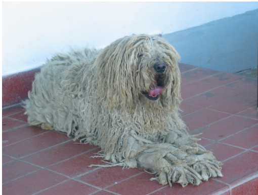
Typisch für den Komondor aus Ungarn ist sein verfilztes Fell