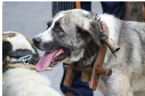
Zum Schutz gegen Wölfe trägt dieser spanische Mastino ein Stachelhalsband