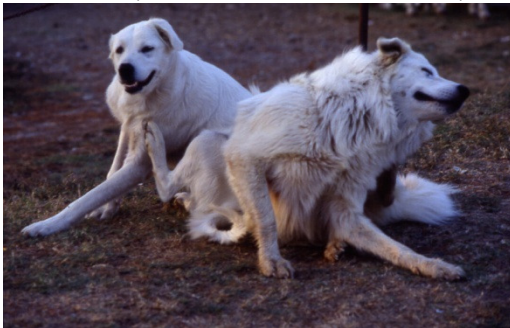
Große weiße Maremmenhunde bewachen die Schafe in den Abruzzen